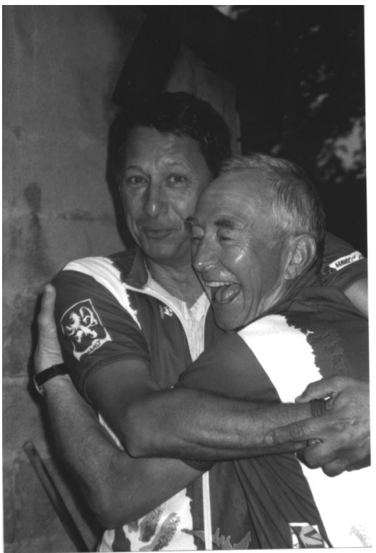
Illustration : Maurice WEY

Force de nous prendre pour des PIGEONS... Ça devait finir par arriver!